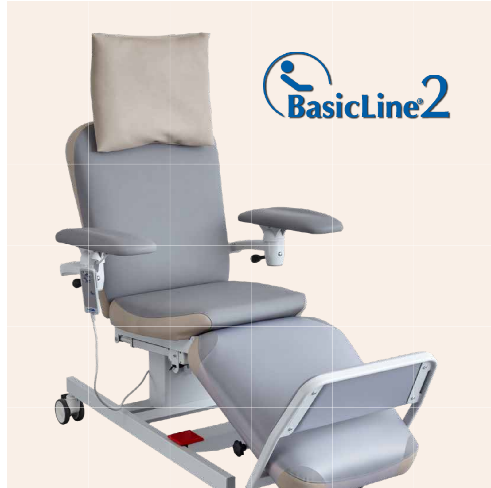
Abbildung enthält optionales Zubehör