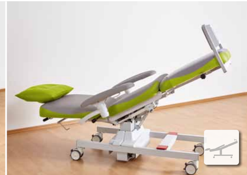
Schnelle Schocklage im Notfall

Die neue UniversalLine2 eignet sich bestens für die ambulante Betreuung Ihrer Patienten.