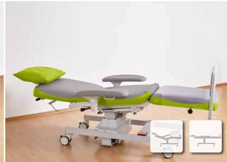
Optimale, individuelle Entspannung durch einzeln anpassbare Segmente