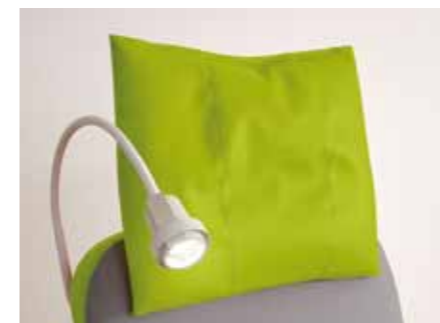
Das bequeme Kopfkissen kann mit einer Sternschraube individuell in der Höhe verstellt werden.