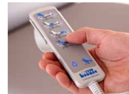
Der beleuchtete Handschalter ist klar gestaltet und ermöglicht die einfache Verstellung der einzelnen Segmente.