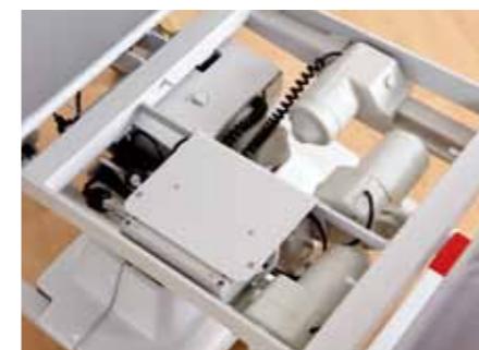
Die vier Motoren sind servicefreundlich direkt unter dem abnehmbaren Sitzteil positioniert.