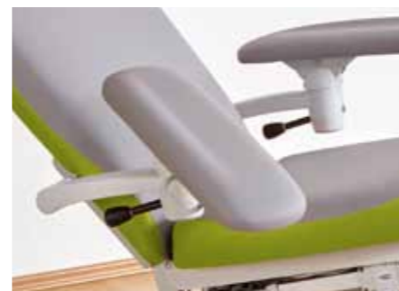
Die Armstütze wird mit Hilfe des Hebels intuitiv und einfach zur Seite geschwenkt, für die optimale Position ist sie nach vorne absenkbar.

Die farbliche Anpassung der Therapieliege an die Einrichtung Ihrer Station ist durch die vielen verschiedenen Farben und das schicke Bi-Color Design möglich. Neben den Farbmustern rechts sind noch weitere Farben erhältlich. Bitte sprechen Sie uns auf die umfangreiche Farbkarte an.