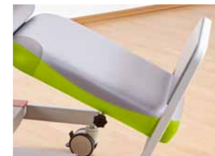
Die manuell verstellbare Fußstütze gibt sowohl kleinen als auch großen Patienten ein sicheres Gefühl während der Behandlung.