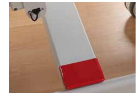
Der große rote Fußtaster ermöglicht die schnelle Einstellung der Schockposition von beiden Seiten – die Hände des Pflegepersonals bleiben für den Patienten frei.