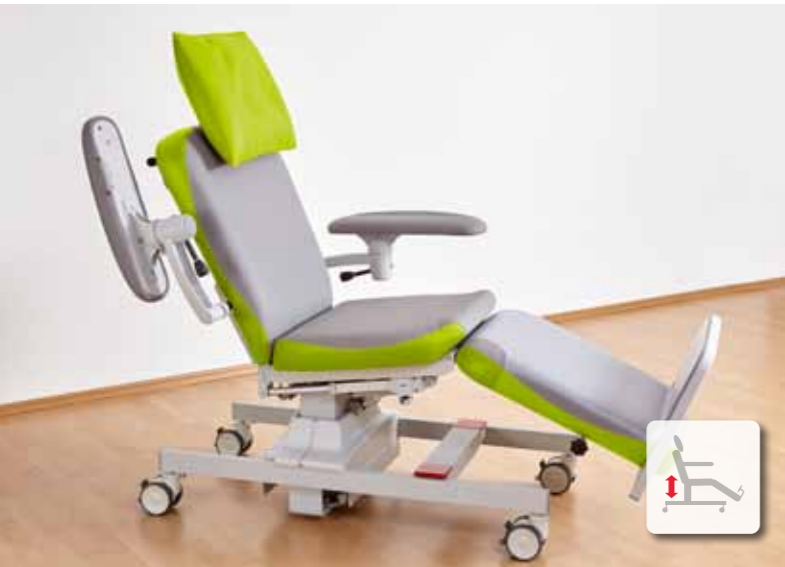
Vorprogrammierte Sitzposition für den Ein- und Ausstieg