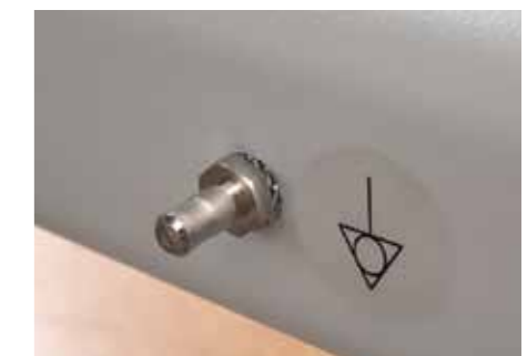
Der Potentialausgleich gemäß EN 60601 erhöht die Sicherheit für Ihre Patienten