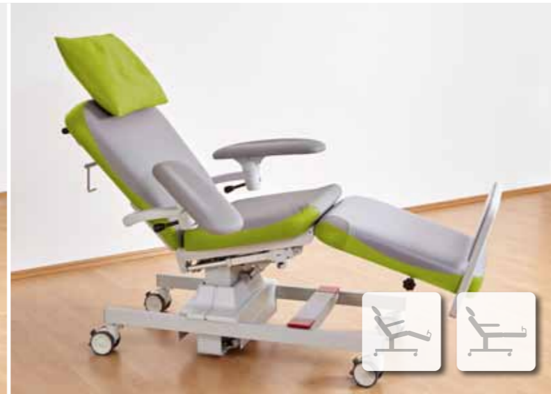
Schnelle Einstellung der Armlehnen